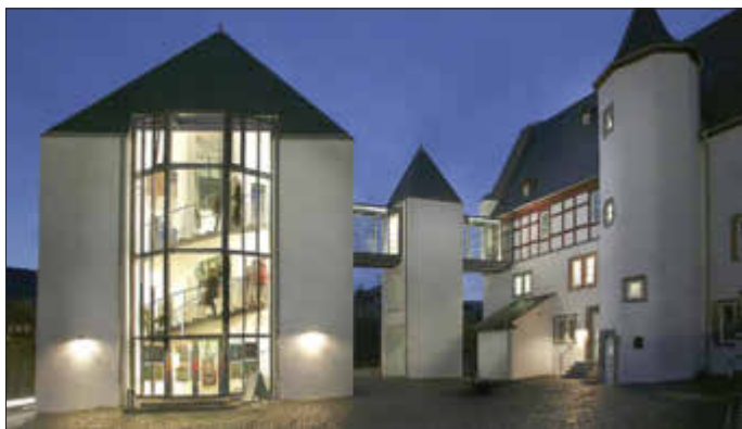
Die Pforten des Lahnsteiner Theaters bleiben vorerst geschlossen.

Die beiden Stücke „Mit siebzehn hat man noch Träume“ und „Alice im Wunderland“ werden in dieser Spielzeit nicht mehr nachgeholt, sondern im nächsten Winter gezeigt. Auch das Gastspiel „Do you contemporary dance?“ und das Stück „Die Taube“ sind abgesagt.