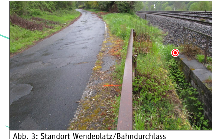
Abb. 3: Standort Wendeplatz/Bahndurchlass