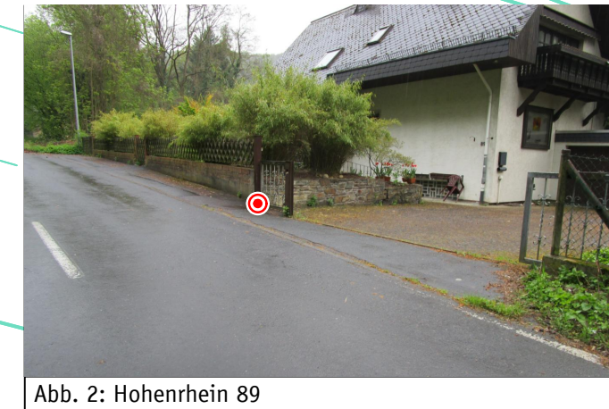
Abb. 2: Hohenrhein 89