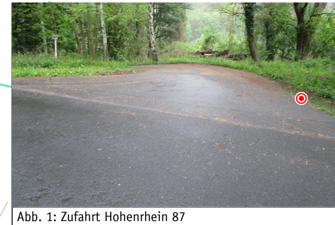
Abb. 1: Zufahrt Hohenrhein 87