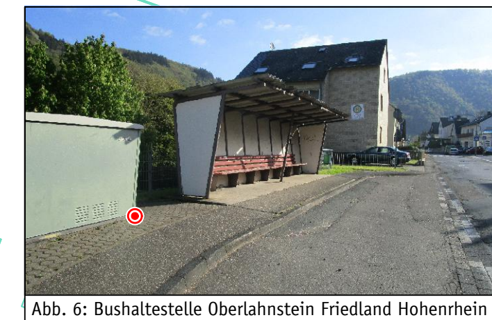
Abb. 6: Bushaltestelle Oberlahnstein Friedland Hohenrhein

Bushaltestelle Oberlahnstein Friedland Hohenrhein DB BAHN Rhein-Mosel-Bus Linie 573 Richtung Koblenz Zentralplatz/Forum Görgenstr. Montags - Freitags stündlich (6:21 Uhr bis 19:21 Uhr) Schulbus Oberlahnstein Schulzentrum (7:37 Uhr) 15 Busse/Tag