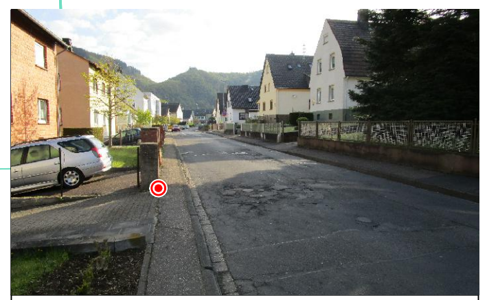
Abb. 1: Einblick Straßenzug - Höhe Hohenrhein 35