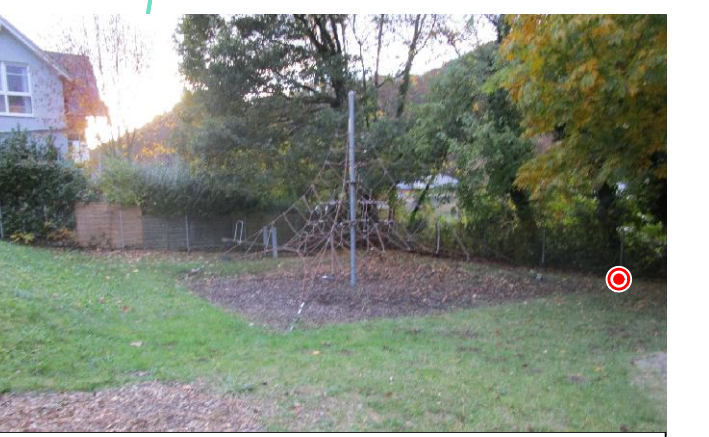
Abb. 5: Spielplatz - Kletterpyramide