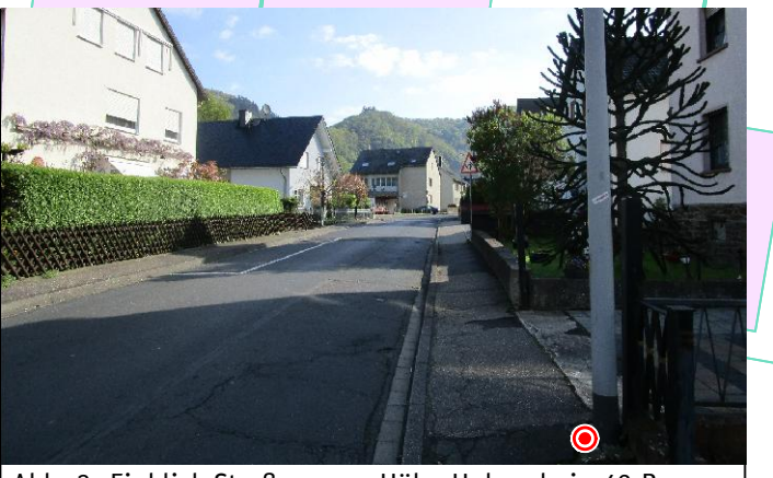
Abb. 3: Einblick Straßenzug - Höhe Hohenrhein 42 B

Bushaltestelle Oberlahnstein Friedland Hohenrhein DB BAHN Rhein-Mosel-Bus Linie 573 Richtung Oberlahnstein Friedland Hinter Lahneck Montags - Freitags stündlich (8:59 Uhr bis 18:59 Uhr) Schulbus Oberlahnstein Schulzentrum (13:23 Uhr) 15 Busse/Tag