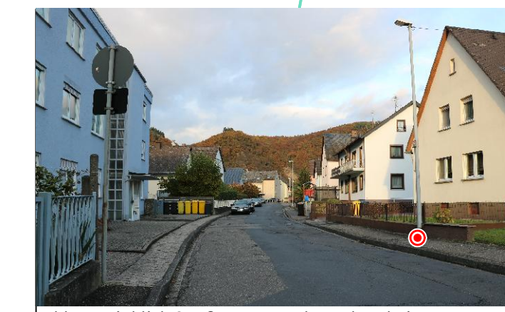
Abb. 2: Einblick Straßenzug - Höhe Hohenrhein 45