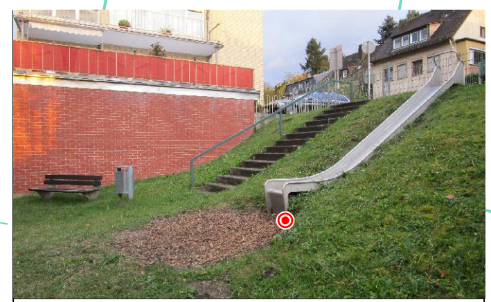
Abb. 4: Spielplatz - Zugang, Rutsche