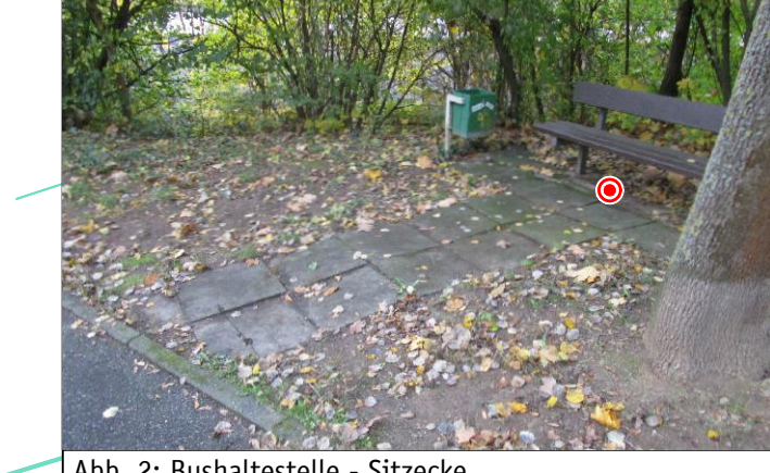
Abb. 2: Bushaltestelle - Sitzcke