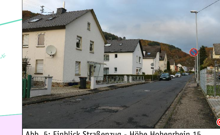
Abb. 5: Einblick Straßenzug - Höhe Hohenrhein 15