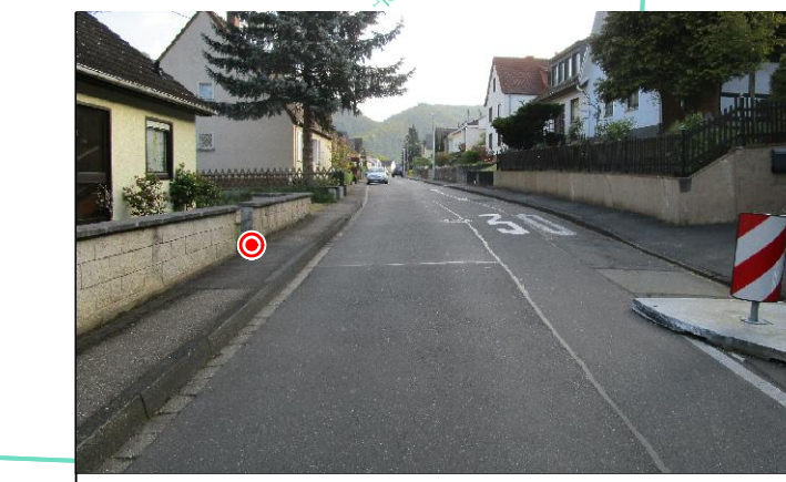
Abb. 3: Seitliche Einengung zur Verkehrsberuhigung