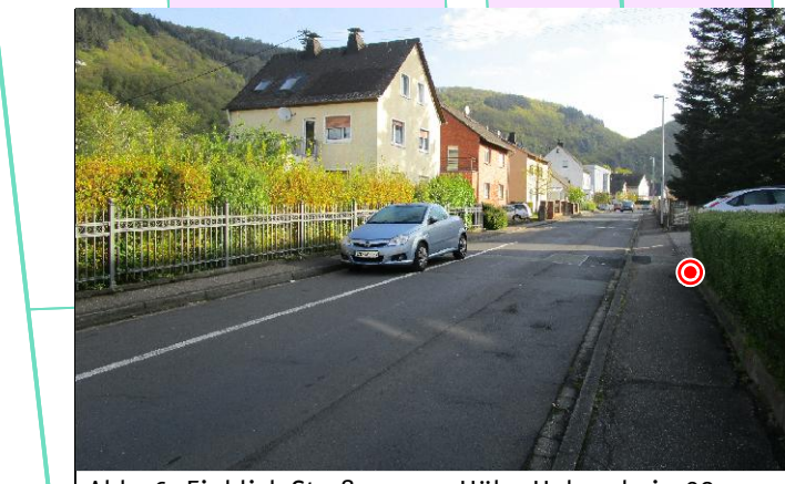
Abb. 6: Einblick Straßenzug - Höhe Hohenrhein 28