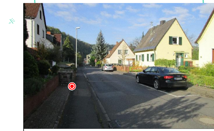
Abb. 4: Einblick Straßenzug - Höhe Hohenrhein 24