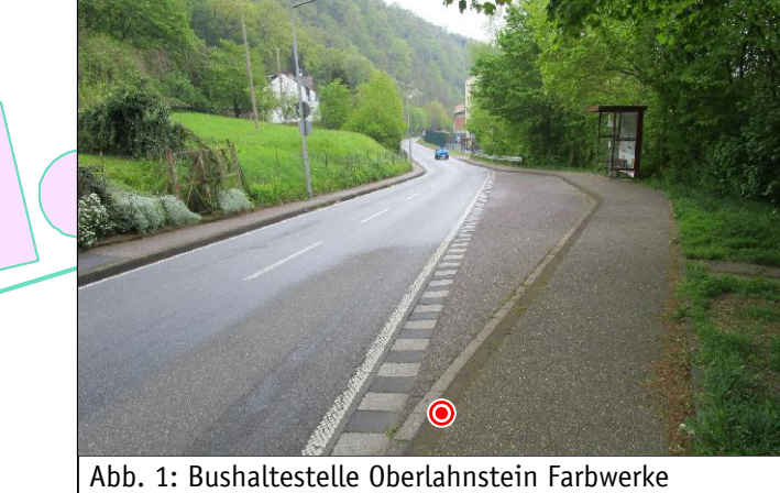
Abb. 1: Bushaltestelle Oberlahnstein Farbwerke

Bushaltestelle Oberlahnstein Farbwerke DB BAHN Rhein-Mosel-Bus Linie 573 Richtung Koblenz Zentralplatz/Forum Göggenstraße Montags - Freitags stündlich (6:23 Uhr bis 19:23 Uhr) Schulbus Oberlahnstein Schulzentrum (7:38 Uhr) 15 Busse/Tag