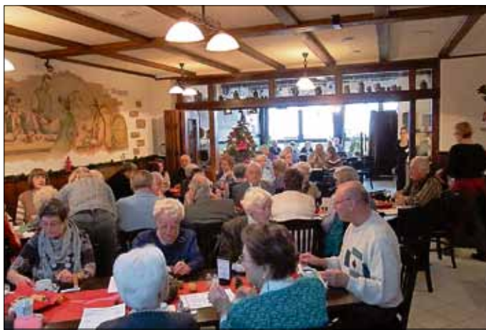
Ein Teil der Gäste